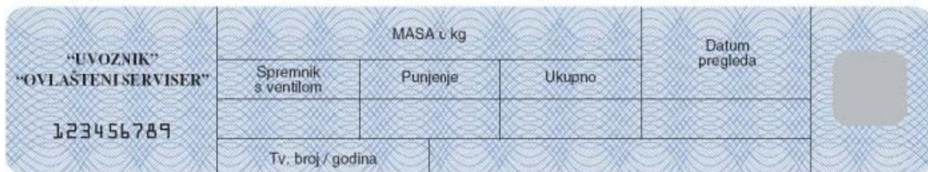
Slika 1. a