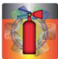
Slika 5. Izgled holograma u prirodnoj veličini